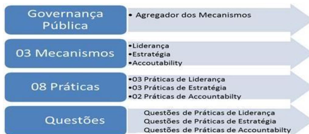
Figura 2: Desenho da estrutura do levantamento do tema Governança Pública.

Dentro dos questionários aplicados, as perguntas foram classificadas em três categorias: Questões dos modelos “tipo M”, Questões dos modelos “tipo A” e Questões dos modelos “tipo E”, onde foram analisados e apresentados dados referentes às respostas dos questionários relacionados à dimensão ou tema da avaliação, “governança pública” em seus 03 mecanismos e em suas 08 práticas, conforme a sintetiza a figura a seguir: